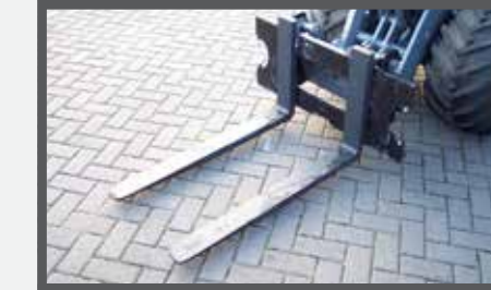
NL PALLETVORKEN EN PALLET FORKS DU PALLETENGABEL FR FOURCHES À PALLETES