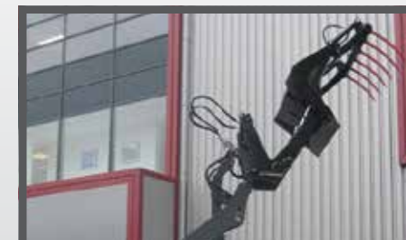
NL HOOGKIEP PELIKAANBAKKEN EN HIGH TIP PELICAN BUCKETS DU HOCHKIPP PELIKANSCHAUFEL FR BENNES PÉLIKAN BASCULANTES