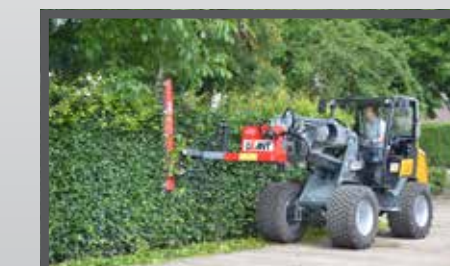
NL HEGGENSCHAAR EN HEDGE CUTTER DU HECKENSCHERE FR TAILLE-HAIE