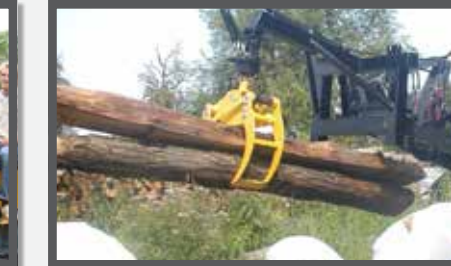
NL HOUTKLEMMEN EN WOOD CLAMPS DU HOLZKLEMMER FR GRIFFES À BOIS