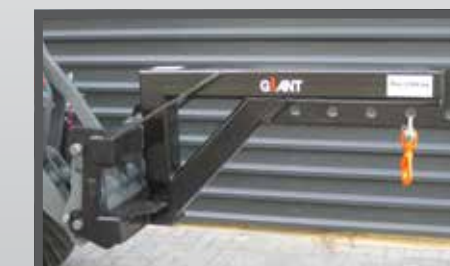
NL JIPPEN EN JIB BOOMS DU AUSLEGARM FR BRAS RADIAUX