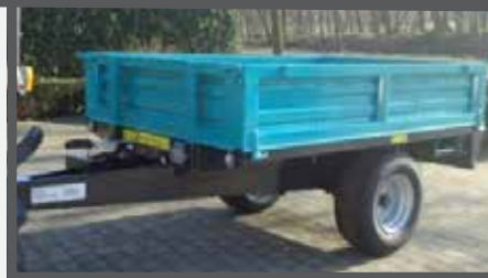
NL KIPPER EN TIPPING TRAILER DU KIPPANHÄNGER FR REMORQUE À BASCULE