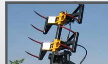
NL BALENGRIJPERS EN BALE CLAMPS WITH TEETH DU BALLENZANGE FR GRAPPINS POUR BALLES