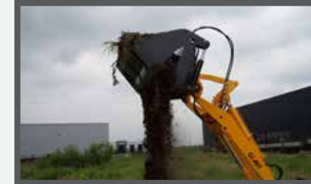
NL 4 IN 1 BAKKEN EN 4 IN 1 BUCKETS DU DROTTSCHAUFEL 4:1 FR PELLÉS 4 EN 1