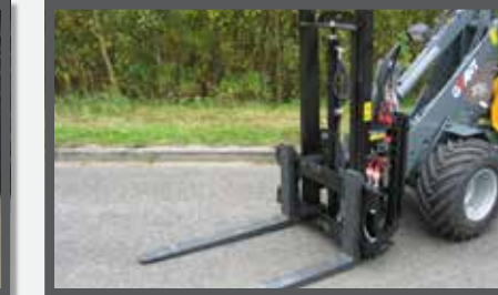
NL HEFMASTEN EN PALLET LIFT DU PALLETENHUBSTAPLER FR MÂTS DE LEVAGE