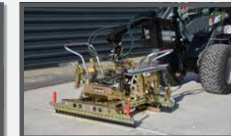
NL MACHINALE LEGKLEMMEN EN STONE INSTALLATION CLAMP DU PFLASTERVERLEGEZANGE FR GRIFFES DE DÉPÔT MACHINALES