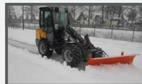
NL SNEEUWSCHUIVERS EN SNOW PLOWERS DU SCHNEERAUMSCHILDER FR LAMES À NEIGE