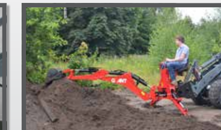
NL KRAANARM HYDR. EN EXCAVATOR ARM HYDR. DU BAGGERARM FR BRAS EXCAVATEUR