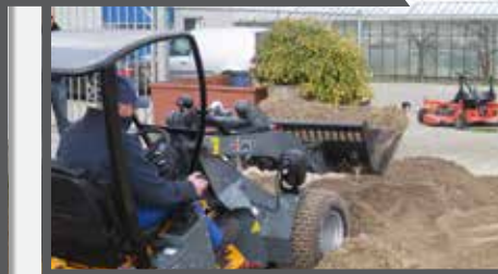
NL PUINBAKKEN COMPACT EN WASTE BRICK BUCKETS COMPACT DU SCHUTTSCHAUFEL FR BENNES À GRAVATS COMPACT