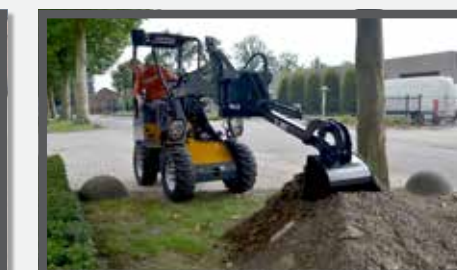
NL GRAAFARM COMPACT EN DIGGER ARM COMPACT DU BAGGERARM KOMPAKT FR BRAS EXCAVATEUR COMPACT