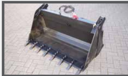
NL 4 IN 1 BAKKEN GELASTE TANDEN EN 4 IN 1 BUCKETS WELDED TEETH DU DROTTSCHAUFEL 4:1 GESCHWESST REISSZÄHNE FR PELLÉS 4 EN 1 DENTS SOUDÉES