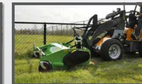
NL KLEPELMAAIERS COMPACT EN FLAIL MOWERS COMPACT DU SCHLEGELMULCHER KOMPAKT FR FAUCHEUSE À FLÉAU COMPACT