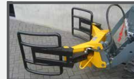
NL BALENKLEMMEN EN BALE CLAMPS DU BALLENZANGE FR GRIFFES POUR BALLES