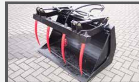
NL PUINBAKKEN MET KLEM EN WASTE BRICK BUCKETS WITH CLAMP DU SCHUTTSCHAUFEL MIT ZANGE FR BENNES À GRAVATS, AVEC GRIFFE