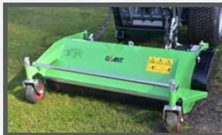
NL KLEPELMAAIERS EN FLAIL MOWERS DU SCHLEGELMULCHER FR FAUCHEUSE À FLÉAU