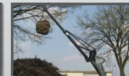
NL HIJSBOKKEN EN LIFTING ARMS DU KRANARM FR BLOCS DE HISSAGE