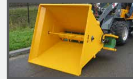
NL VERDEELBAKKEN (VDB) EN DIVIDE BUCKETS (VDB) DU VERTELSCHAUFEL (VDB) FR BENNES DE DISTRIBUTION (VDB)