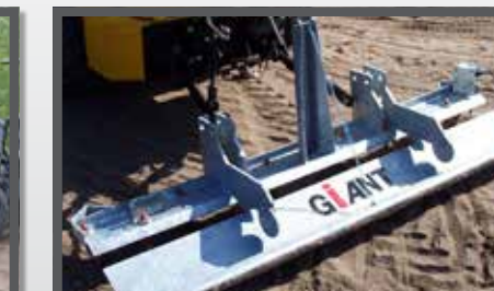
NL MANEGVLAKKERS EN LEVELLERS DU REITBAHNPLANER FR HERSES POUR MANÈGES