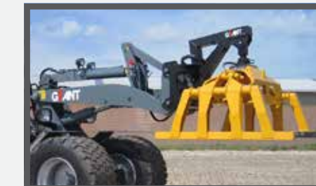
NL PAKKENKLEMMEN EN STONE CLAMP DU STEINZANGE FR GRIFFE À PAQUETS