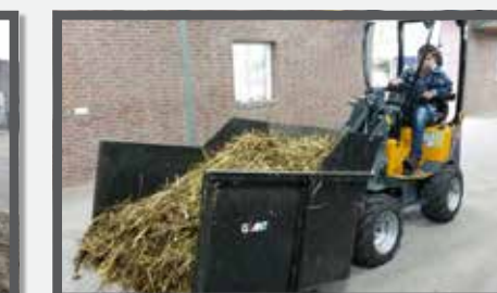
NL MEST CONTAINER COMPACT EN MANURE CONTAINER COMPACT DU CONTAINERSCHAUFEL KOMPAKT FR BENNES À FUMIER DE CHEVAL