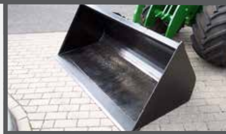
NL GRONDBAKKEN EN EARTH BUCKETS DU ERD SCHAUFEL FR PELLÉS À TERRE