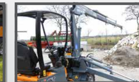
NL KRAAN ARM COMPACT EN CRANE ARM COMPACT DU KRANARM KOMPAKT FR GRUE BRAS COMPACT

ANY GIANT ATTACHMENT CAN BE FITTED WITH A COMPACT HITCH