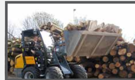
NL VOLUME BAKKEN EN HIGH VOLUME BUCKETS DU LEICHTGUTSCHAUFEL FR BENNES POUR VOLUME