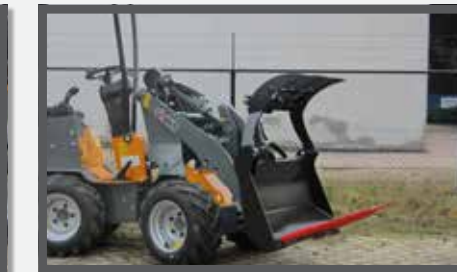
NL MESTVORKEN MET KLEM COMPACT EN MANURE FORKS WITH CLAMP COMPACT DU DUNG- UND SILLAGEZANGE KOMPAKT FR FOURCHES À FUMER, AVEC GRIFFE