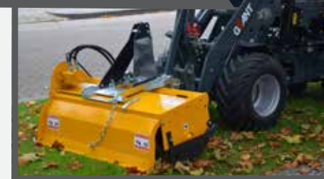
NL GRONDFREES EN ROTARY TILLER DU BODENFRÄSE FR FRAISE