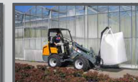
NL BIG BAG HAARKARMEN EN BIG BAG LIFTING ARMS DU BIG BAG HAKEN FR BRAS À CROCHETS POUR BIG BAGS