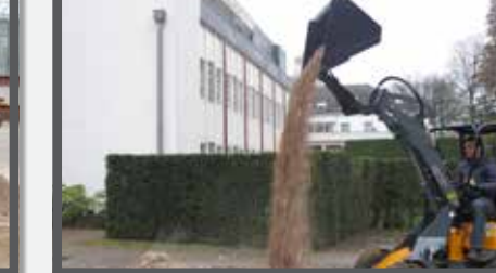
NL HOOGKIPBAKKEN COMPACT EN HIGH TIP BUCKETS COMPACT DU HOCHKIPPSCHAUFEL KOMPAKT FR BENNES BASCULANTES COMPACT