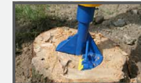
NL STOBENBOOR EN STUMP GRINDER DU BAUMSTUMPBOHRER FR DÉRACINEUR DE SOUCHES