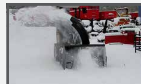
NL SNEEUWFREES EN SNOW PLOWERS DU SCHNEEFÄSE FR SOUFFLEUSE À NEIGE