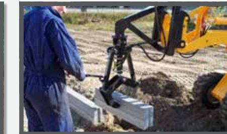
NL BANDENKLEMMEN EN STONELIFTER DU RANDSTEINZANGE FR GRIFFES POUR PNEUS