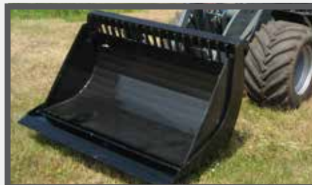
NL PUINBAKKEN EN WASTE BRICK BUCKETS DU SCHUTTSCHAUFEL FR BENNES À GRAVATS