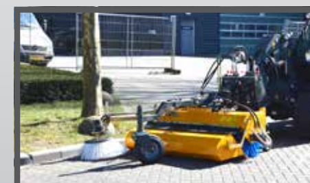
NL VEEGMACHINES EN SWEEPERS DU KEHRMASCHINEN FR BALAYEUSES