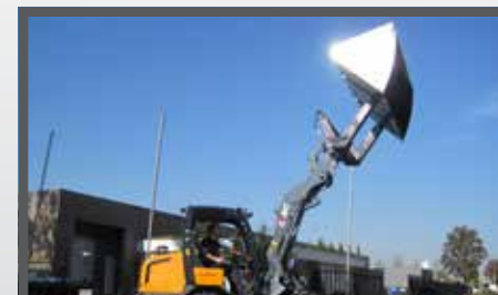
NL HOOGKIEPBAKKEN EN HIGH TIP PELICAN BUCKETS DU HOCHKIPPSCHAUFEL FR BENNES BASCULANTES