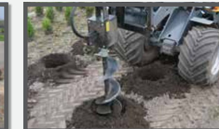
NL GRONDBOREN HYDR. EN HYDRAULIC EARTH DRILLS DU ERDBOHRERÄT FR TARIÈRES HYDRAULIQUES