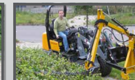
NL HEGGENSCHAAR EN HEDGE CUTTER DU HECKENSCHERE FR TAILLE-HAIE