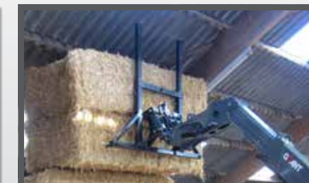
NL BALENVORKEN EN BALE FORKS DU BALLENSPIEß FR FOURCHES À BALLES