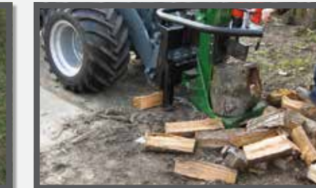
NL HOUTKLOOFMACHINE EN LOG SPLITTER DU HOLZSPALTER FR FENDEUSE À BOIS