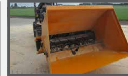
NL VERDEELBAKKEN (MVB) EN DIVIDE BUCKETS (MVB) DU VERTELSCHAUFEL (MVB) FR BENNES DE DISTRIBUTION (MVB)