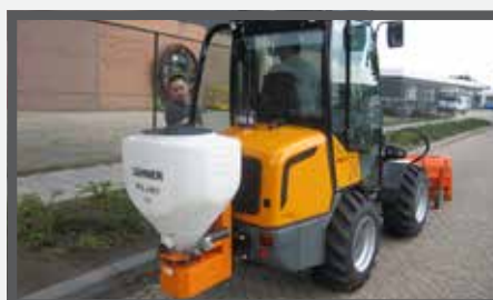
NL ZOUTSTROOIERS EN SALT SPREADERS DU STREUER FR ÉPANDEURS DE SEL