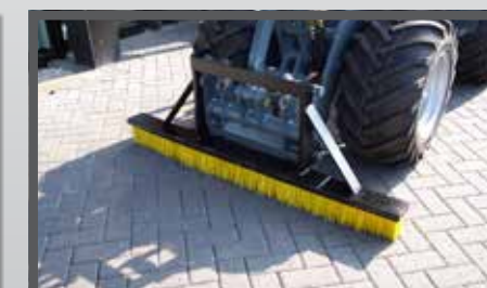
NL INVEEGBORSTELS EN BRUSH DU KEHRBÜRSTE FR BROSSES À BALAYER