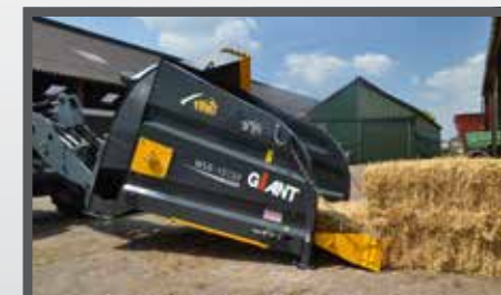
NL STROBLAZERS EN STRAWBLOWERS DU STROHGEBLÄSE FR SOUFFLEURS DE PAILLE