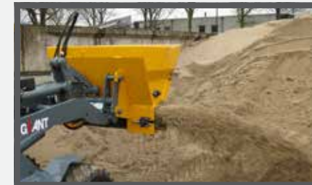
NL VERDEELBAKKEN (ZVDB) EN DIVIDE BUCKETS (ZVDB) DU VERTELSCHAUFEL (ZVDB) FR BENNES DE DISTRIBUTION (ZVDB)