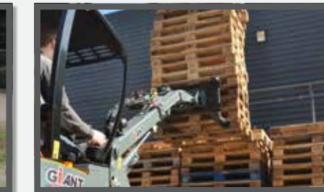
NL PALLETVORKEN COMPACT EN PALLET FORKS COMPACT DU PALETTEGABEL KOMPAKT FR FOURCHES À PALETTES COMPACT