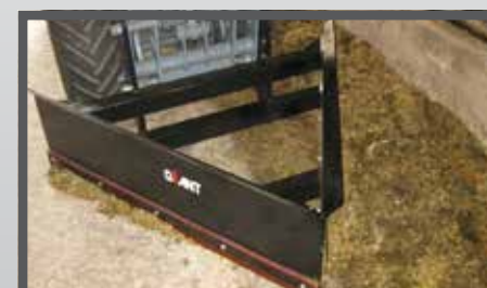
NL VOER- MEST PIJLSCHUIF EN FEED- AND MANURESCRAPER DU FUTTER- UND SCHMUTZSCHIEBER FR LAME À FOURRAGE - FUMIER