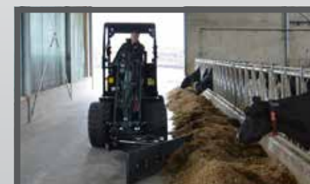
NL VOER- MESTSCHUIVEN EN FEED- AND MANURESCRAPER DU FUTTER- UND SCHMUTZSCHIEBER FR LAME À FOURRAGE - FUMIER