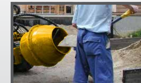
NL BETONMOLEN EN CONCRETE MIXER DU BETONIERMACHINE FR BÉTONNIÈRE