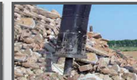
NL HYDR. SLOOPHAMER EN HYDR. SLEDGEHAMMER DU HYDR. BRECHER FR HYDR. BRISEUR