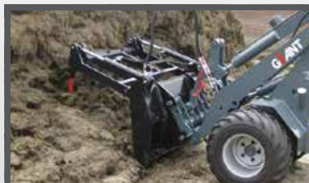
NL MESTVORKEN EN MANURE FORKS DU DUNG- UND SILLAGEZANGE FR FOURCHES À FUMIER