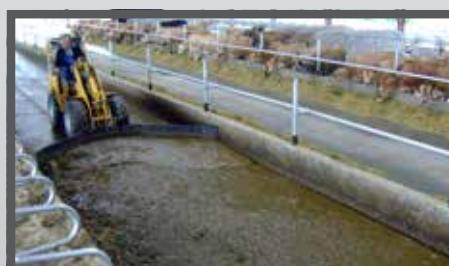
NL VOER- MESTSCHUIVEN EN FEED- AND MANURESCRAPER DU FUTTER- UND SCHMUTZSCHIEBER FR LAME À FOURRAGE - FUMIER