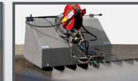
NL STRAATREINIGINGS UNIT EN STREET WASHING UNIT DU STRASSENREINIGUNGSANLAGE FR UNITÉ DE LAVAGE DE LA VOIRIE