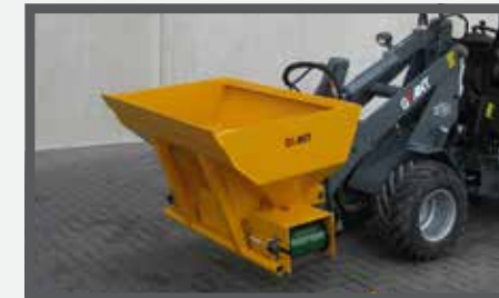
NL DIEPSTROOISELBAKKEN (DSB) EN DEEP-LITTER BUCKETS (DSB) DU TIEFSTREUSCHAUFEL (DSB) FR ÉPANDEURS PROFONDS (DSB)