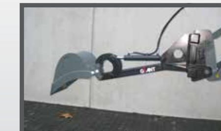
NL GRAAFARM EN DIGGER ARM DU BAGGERARM FR BRAS EXCAVATEUR