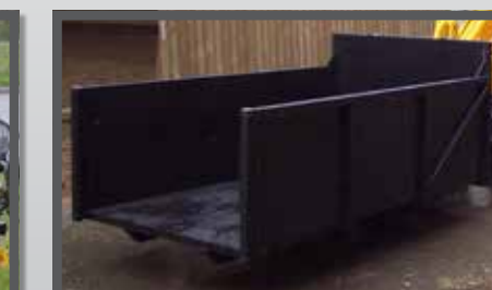
NL PAARDENMESTBAKKEN EN MANURE CONTAINER DU CONTAINERSCHAUFEL FR BENNES À FUMIER DE CHEVAL