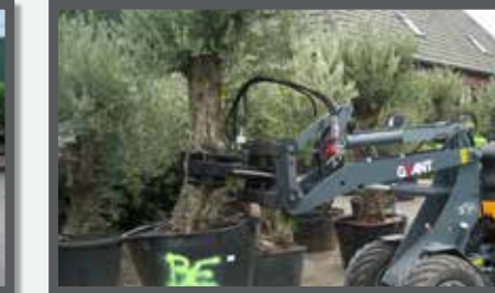
NL BOMENKLEMMEN EN TREE CLAMPS DU BAUMKLEMMER FR GRIFFES À ARBRES