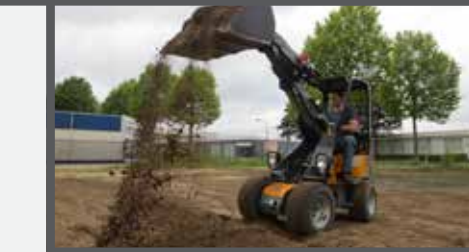
NL GRONDBAKKEN COMPACT EN EARTH BUCKETS COMPACT DU ERDSCHAUFEL KOMPAKT FR PELLES À TERRE COMPACT