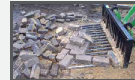
NL TEGELRIEKEN EN BROKEN STONE FORK DU STEINENGABEL FR FOURCHES À CARREAUX