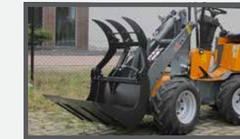
NL PELIKAANBAKKEN COMPACT EN PELICAN BUCKETS COMPACT DU PELIKANSCHAUFEL COMPACT FR BENNES PÉLIKAN COMPACT