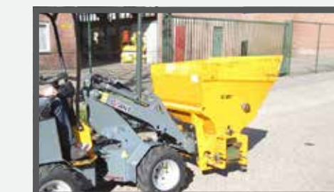
NL VERDEELBAKKEN COMPACT EN DIVIDE BUCKETS COMPACT DU VERTEILSCHAUFEL KOMPAKT FR BENNES DE DISTRIBUTION