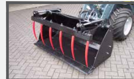
NL PELIKAANBAKKEN EN PELICAN BUCKETS DU SCHUTTSCHAUFEL MIT ZANGE FR BENNES PÉLIKAN