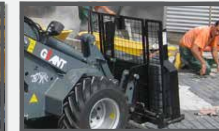
NL STENENKLEMMEN EN STONE CLAMPS DU STEINZANGE FR GRIFFES À PIERRES