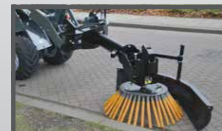
NL ONKRUIDBORSTELS EN WEED BRUSH DU WILDKRAUTBÜRSTE FR BROSSES POUR MAUVAISES HERBES