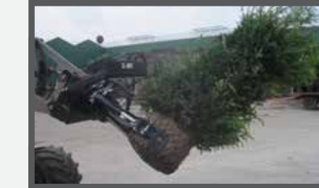
NL KLUITENKLEMMEN EN ROOT BALL CLAMPS DU WURZELBALLENKLEMMER FR GRIFFES À ARBRES