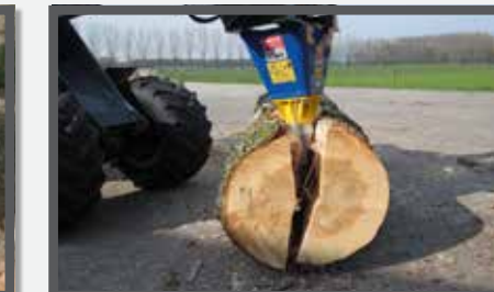
NL HOUTSPLIJTER EN LOG SPLITTER DU KEGELSPALTER FR FENDEUSE À BOIS