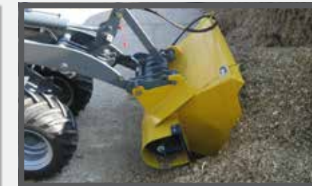
NL VOERBAKKEN EN FEED BUCKETS DU FUTTERDOSIERGERÄT FR BENNES À FOURRAGE