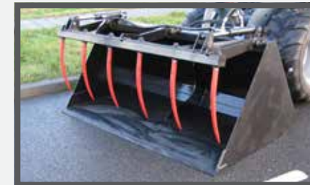
NL VOLUME BAKKEN MET KLEM EN HIGH VOLUME BUCKETS WITH CLAMP DU LEICHTGUTSCHAUFEL MIT ZANGE FR BENNES POUR VOLUME, AVEC GRIFFE