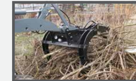
NL HOUTKLEMMEN HORIZONTAAL EN WOOD CLAMPS HORIZONTAL DU HOLZKLEMMER HORIZONTAL FR GRIFFES À BOIS HORIZONTALES