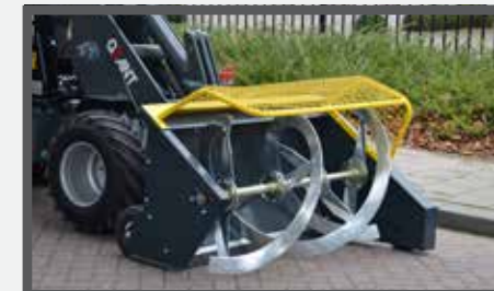
NL VOERVIJZEL EN FOOD AUGER DU FUTTERAUFBEREITER FR L'UNITÉ DE PRÉPARATION DU FOURRAGE