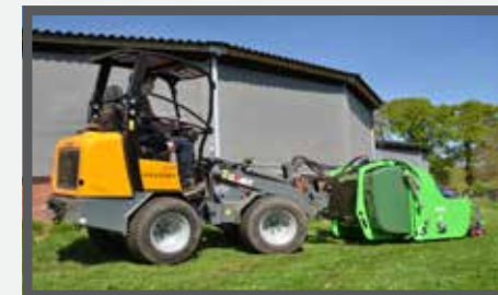
NL KLEPELMAAIERS MET OPVANGBAK EN FLAIL MOWERS WITH COLLECTOR DU SCHLEGELMULCHER MIT AUFNAHMBEHÄLTHER FR FAUCHEUSE À FLÉAU BENNE DE RÉCEPTION