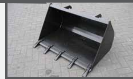
NL GRONDBAKKEN MET GESCHROEFDE TANDEN EN EARTH BUCKETS WITH BOLTED TEETH DU VERTELSCHAUFEL MIT GESCHRAUBT REISSZÄHNE FR PELLÉS À TERRE DENTS VISSEES