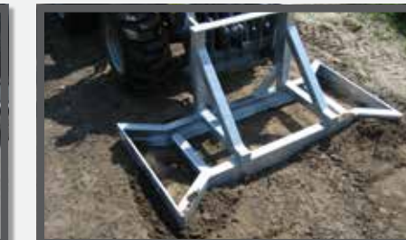
NL EGALISATIEFRAMES EN LEVELLING FRAME DU PFLASTERVERLEGEZANGE FR CADRES D'ÉGALISATION