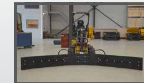
NL VOER- MESTSCHUIF COMPACT EN FEED- AND MANURESCRAPER COMPACT DU FUTTER- UND SCHMUTZSCHIEBER FR LAME À FOURRAGE - FUMIER COMPACT