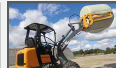
NL BALENKLEMMEN EN BALE CLAMPS DU BALLENZANGE FR GRIFFES POUR BALLES