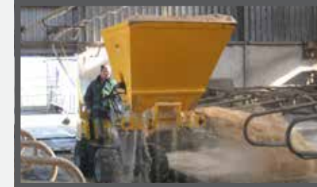
NL VERDEELBAKKEN (ZV) EN DIVIDE BUCKETS (ZV) DU VERTELSCHAUFEL (ZV) FR BENNES DE DISTRIBUTION (ZV)