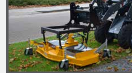
NL CIRKELMAAIERS EN ROTARY MOWERS DU SICHELMÄHER FR FAUCHEUSES ROTATIVES