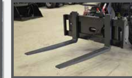
NL PALLETVORKEN SIDESHIFT EN PALLET FORKS SIDESHIFT DU HYDRAULISCHE PALLETENGABEL FR FOURCHES À PALLETES HYDRAULIQUE