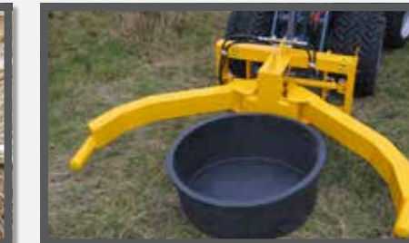
NL POTTENKLEMMEN EN POT CLAMPS DU GREIFZANGE FR GRIFFES À POTS